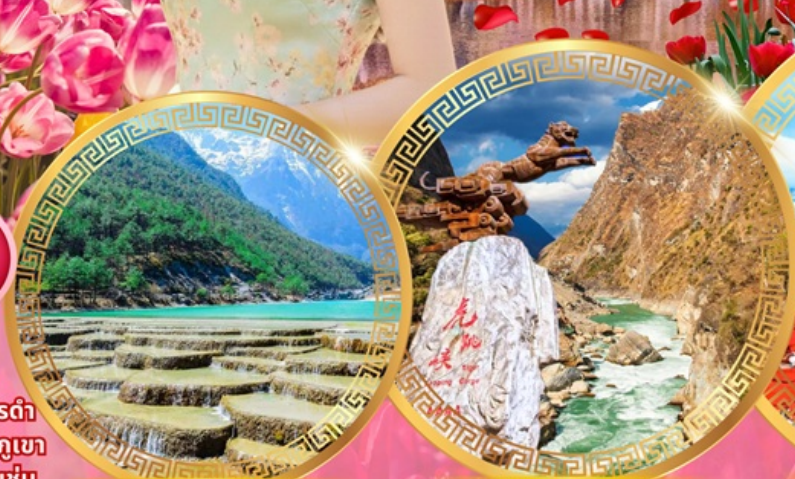
ทะเลสาบไป๋สยเหอ

วัดชงจันหลิน ช่องแคบเสือกะโจน สระมังกรดำ เมืองโบราณลี่เจียง ภูเขาหิมะมังกรหยก ชมวิวภูเขา หิมะที่ร้าน Yun di ta ชมดอกไม้ที่สวนอุทยานชุ่ม น้ำโกวหนาน ชมดอกซากุระสวนหยวนทง