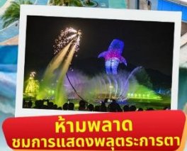
ห้ามพลาด ชมการแสดงพุทธรักษา