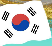
ตลาดกวางจัง