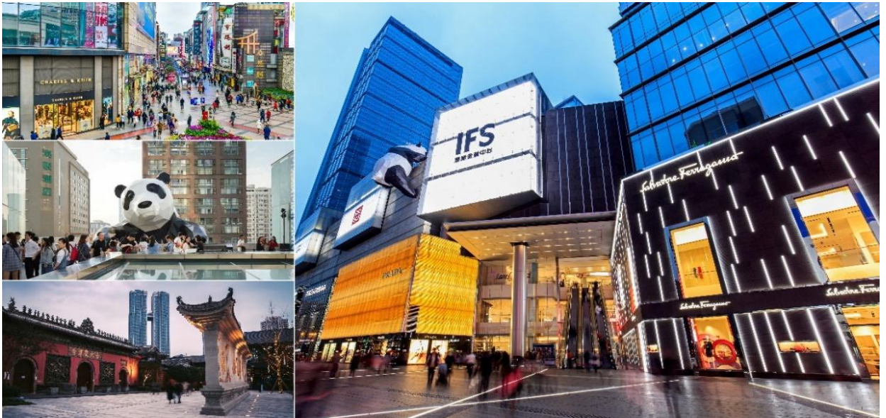
อิสระอาหารค่ำ ตามอัธยาศัย

นำท่านชมจุดเช็คอินที่ หมี่แพนด้ายักษ์ปิ่นตึก (IFS BUILDING) เป็นแพนด้าที่อ้วนน่ารักกำลังปิ่นปายตึก เป็นประติมากรรมแพนด้ายักษ์แขวนอยู่บนอาคาร IFS ในใจกลางเมืองเจิงตู