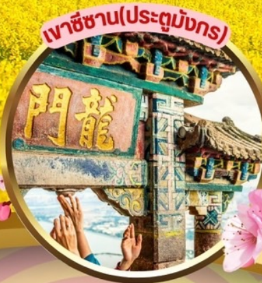
เวาชีซาน(ประตูมังกร)