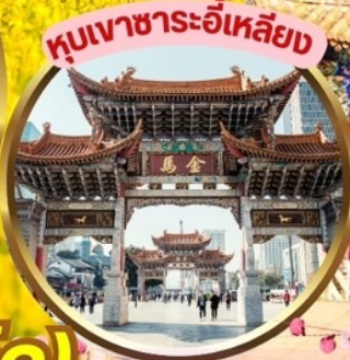
หุบเขาระอี้เหลียง