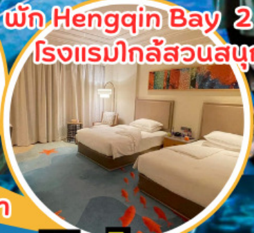
พัก Hengqin Bay 2 คืน!! โรงแรมใกล้สวนสนุก