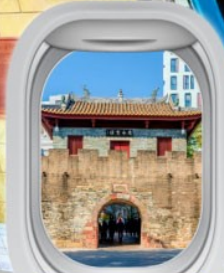
เมืองโบราณหนาวโก