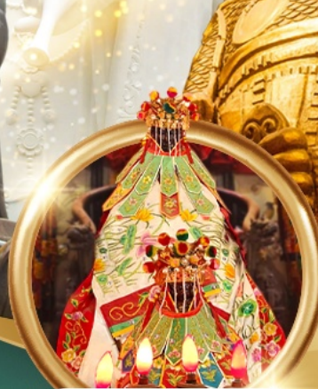
เยี่ยมเงินเจ้าแม่กวนอิมสองฮา