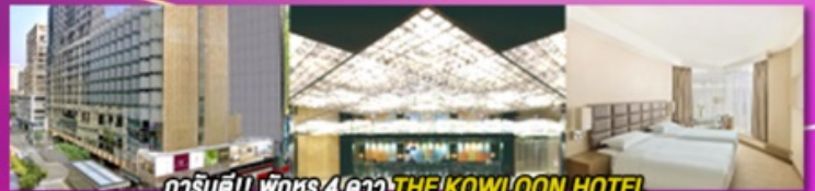
การ์เมนต์!! พิเศษ 4 ดาว THE KOWLOON HOTEL ติดถนนนาธาน ย่านช้อปปิ้งจิมซาจู้