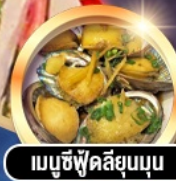
เมนูซีฟู้ดลิ้นยุบนุ่ม