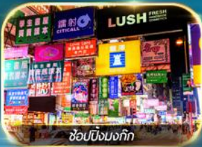
ช้อปปิ้งมงก๊ก

เต็มอิ่มทั้งบุญ และ ช้อปปิ้งแบบจัดเต็ม จิมซาจุ่ย มงก๊ก