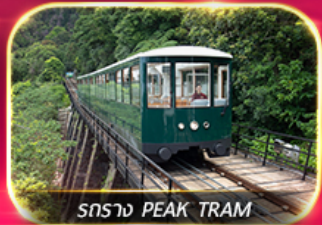
รถราง PEAK TRAM

เที่ยวสวนสนุกแบบจัดเต็ม ทั้งอิมบูกู และ ซอปบิง จิมซาจู้ มงก็อก