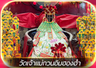
วัดเจ้าแม่กวนอิมสองอ่า