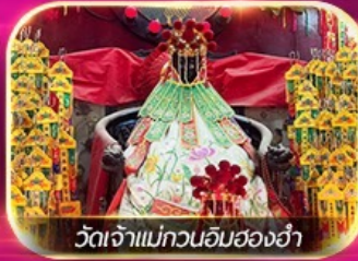
วัดเจ้าแม่กวนอิมสองอ่า