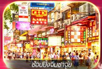
ซอปปิ้งจิมซาจุ่ย

เต็มอิ่มทั้ง ไหว้พระ-ขอพร และ ซอปปิ้งแบบจัดเต็ม รีพัลส์เบย์ มงกีก วัดแชกงหมิว เจ้าแม่กวนอิมของฮำ วัดหวังต้าเซียน ซอปปิ้งจิมซาจุ่ย