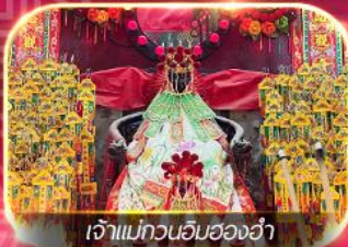
เจ้าแม่กวนอิมของฮำ