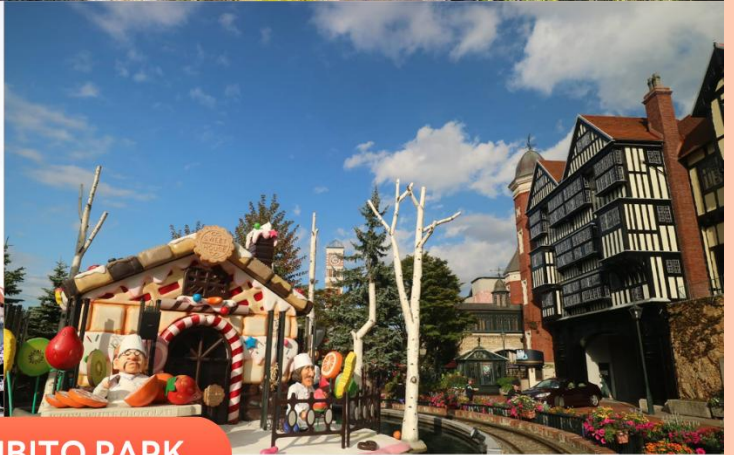
SHIROI KOIBITO PARK