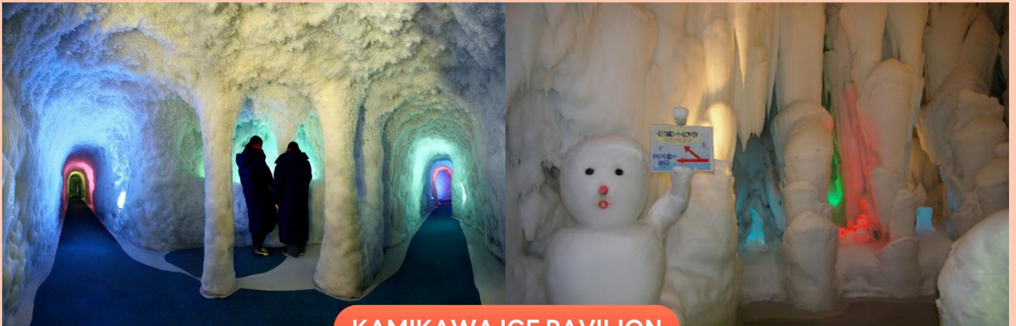
KAMIKAWA ICE PAVILION

จากนั้นนำท่านเดินทางสู่ เมืองคามิดาวะ (Kamikawa) เป็นเมืองที่ตั้งอยู่ในจังหวัดฮอกไกโด โดดเด่นด้วยธรรมชาติอัน อุดมสมบูรณ์ โดยเป็นประตูสู่อุทยานแห่งชาติไดเซตสึซัง เพื่อนำท่านสัมผัสประสบการณ์ความหนาวสุดขั้วที่ พิพิธภัณฑ หิมะและน้ำแข็งคามิดาวะ (Kamikawa Ice Pavilion) ดินแดนแห่งโลกน้ำแข็งที่เปิดให้เข้าชมได้ตลอดทั้งปี ภายในจัด แสดงอุโมงค์น้ำแข็ง และเสาน้ำแข็งขนาดใหญ่ที่ถูกเก็บรักษาไว้ในอุณหภูมิต่ำประมาณ -20 องศาเซลเซียส สร้างบรรยากาศ ราวกับหลุดเข้าไปอยู่ในอาณาจักรน้ำแข็งสุดมหัศจรรย์ พร้อมชมปรากฏการณ์ “Diamond Dust” เกิดน้ำแข็งระยิบระยับ ที่ส่องประกายงดงาม และทดลองสัมผัสอุณหภูมิต่ำสุดที่เคยบันทึกได้ใน ประเทศญี่ปุ่น อีกทั้งยังมีกิจกรรมสุดพิเศษ เช่น การทดลองผ้าขนหนูแข็งตัวในฟรีบตา และมุมถ่ายภาพสวยงามมากมาย ให้ทุกท่านได้เก็บภาพความประทับใจท่ามกลางโลกแห่งความเย็นเยือกที่หาได้ยากจากที่อื่น