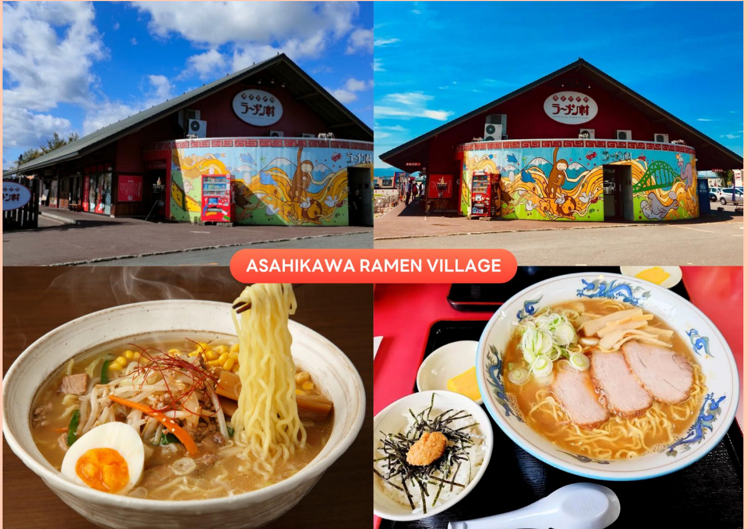
ASAHIKAWA RAMEN VILLAGE

นำท่านเดินทางกลับสู่ เมืองอาซาฮิดาว่า (Asahikawa) เพื่อนำท่านสู่ หมู่บ้านราเมนอาซาฮิดาว่า (Asahikawa Ramen Village) แหล่งรวมราเมนเจ้าดังของเมืองอาซาฮิดาว่า ที่คัดสรรร้านยอดนิยมไว้ถึง 8 ร้านในที่เดียว เพลิดเพลินกับการลิ้มลองราเมนสูตรต้นตำรับฮอกไกโด สไตส์ซูโงยุที่ขึ้นชื่อเรื่องความหอมกลมกล่อม พร้อมเลือกชิมแต่ละร้านได้ตามใจ อีกทั้งยังมีโซนขายของที่ระลึก และพิพิธภัณฑ์เล็ก ๆ ให้ได้เรียนรู้ประวัติราเมนอีกด้วย