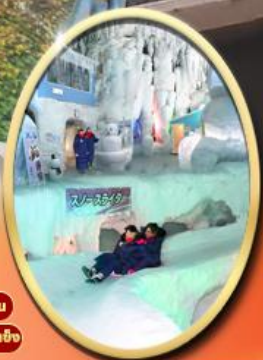
Kamikawa Ice Pavilion