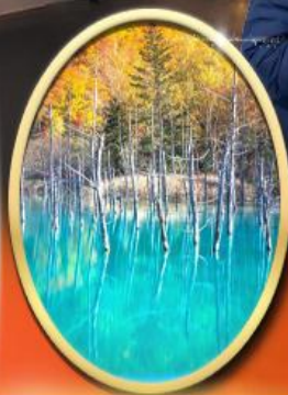
Shiragane Blue Pond