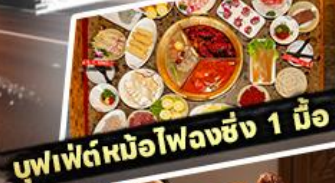
บุฟเฟ่ต์หน่อไพลงชิง 1 มื้อ