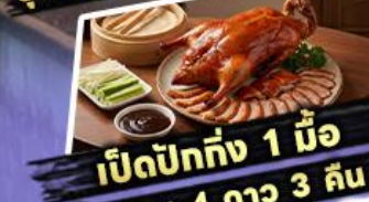
เปิดปากถึง 1 มื้อ

พักรูม 4 ดาว 3 คืน ไฮไลท์ สุดว้าว! ขึ้นลิฟต์แก้วชมความอลังการ กลางหุบเขา