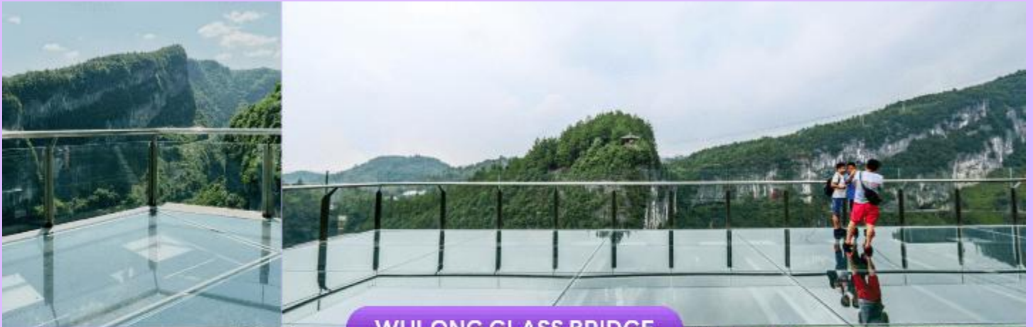
WULONG GLASS BRIDGE