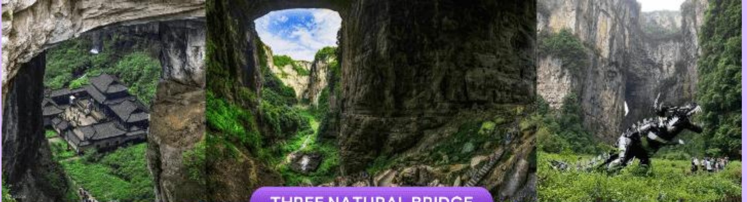
THREE NATURAL BRIDGE