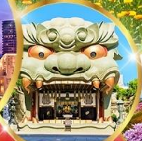
ศาลเจ้านิมมะ ยาชากะ