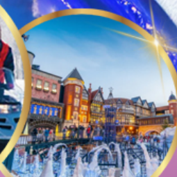
โรงงานช็อคโกแลต ชิโรอิ โคอิมีโตะ