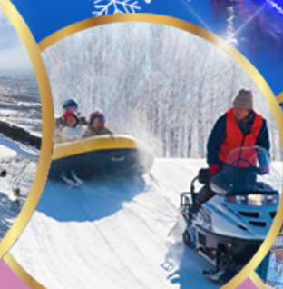
ซิกิไซ สโนว์แลนด์