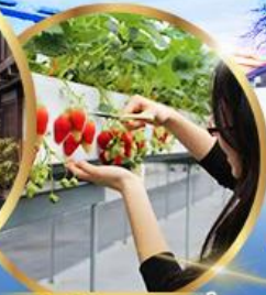
บุฟเฟต์ สดอเบอร์รี่