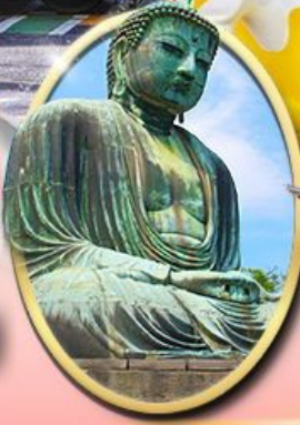
พระใหญ่คามาคุระ