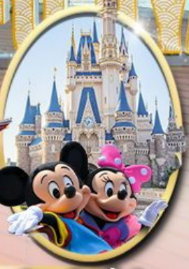
อิสระเลือกซื้อบัตร Tokyo Disneyland