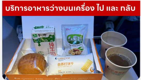
บริการอาหารว่างบนเครื่อง ไป และ กลับ