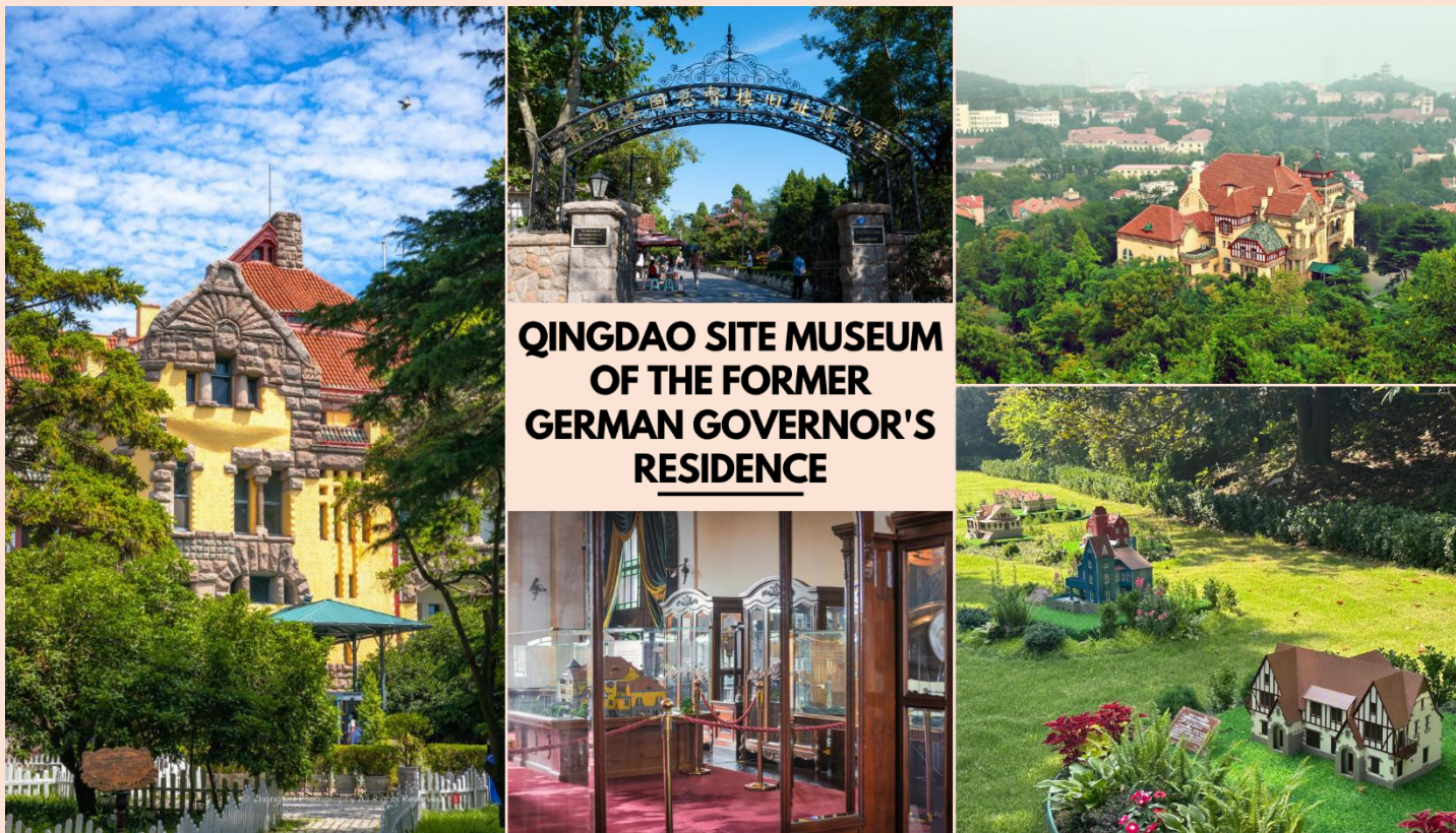
QINGDAO SITE MUSEUM OF THE FORMER GERMAN GOVERNOR'S RESIDENCE