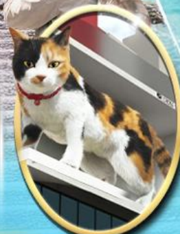
ซอยบิจิ ซินจุกุ