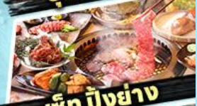
เอ๊ก บิงย่าง