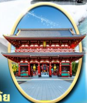
วัด เซ็นโซจิ

ถนนนากาโนะ ซอยบิจิ ตลาดอะบิโท ตลาดเช้า ฝ้ายทอ ถนนซันมาจิซุกุ สะพานนากาบาชิ