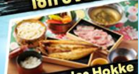
เอ๊กซาบู + ปลา Hokke

36,919 ราคา เริ่มต้น บาท รวมภาษีมูลค่าเพิ่ม 7%