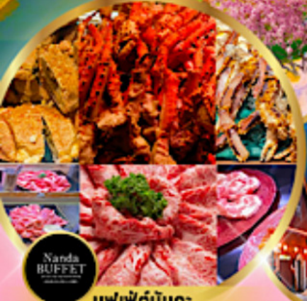
บุฟเฟ่ต์นันทะ ชาบู 3 ชนิด + ซึฟูต + วากิวA5

ราคาเริ่มต้น 39,919 บาท รวมภาษีมูลค่าเพิ่ม 7%