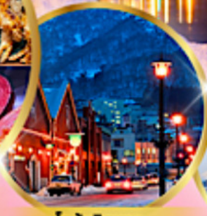
โทดิงอิซุแดง