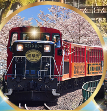
รถไฟสายโรแมนติก