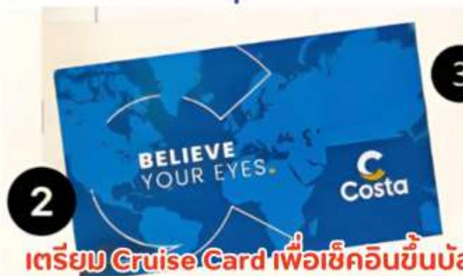
เตรียม Cruise Card เพื่อเช็คอินขึ้นบัส