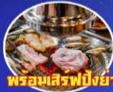
พร้อมเสิร์ฟปิ้งย่างเกาหลี