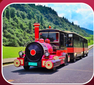
“อุทยานเขานางฟ้า”