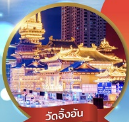
วัดจิ้งจัน