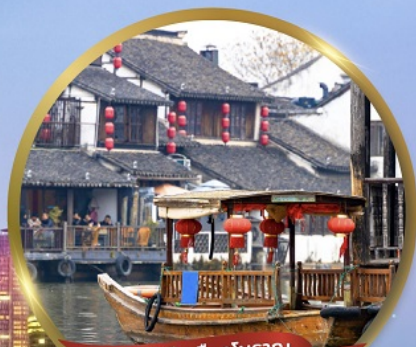
ล่องเรือเมืองโบราณ จูเจียเจียว