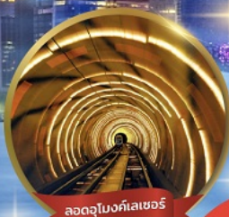
ลอดอุโมงค์เลเซอร์