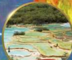
อุกยานหวงหลง