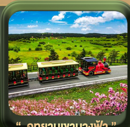
“อุทยานเขานางฟ้า”