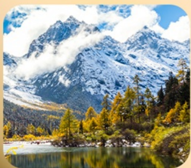
“ปี้ฝิงโกว”

ชมธรรมชาติ 2 อุทยานขึ้นชื่อ อุทยานภูเขาสี่ครุณี + อุทยานปี้ฝิงโกว สะพานหนานเฉียว • ถนนคนเดินไท่กู่หลี่ + ซุนซีลู่ + Pop Mart • ดงเจียวจี้