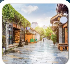
"ชอยกว้างชอยแคบ"