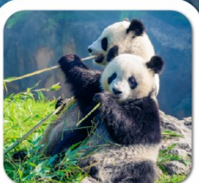
"ศูนย์หมีแพนด้า"