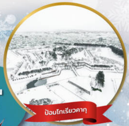
ป้อมโทริเยวคาคุ

หมู่บ้านนิงเกิลเกอเรส • สวนสัตว์อาซาฮิยาม่า • ชมขบวนพาเหรดเพนกวิน ตลาดเช้าฮาโกดาเตะ • ป้อมโทริเยวคาคุ • นั่งกระเช้าชมเมืองฮาโกดาเตะ ลานสกี • HILL OF BUDDHA • ไอตารุ • คลองไอตารุ • หมู่บ้านราเมน