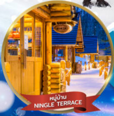
หมู่บ้าน NINGLE TERRACE

สนุกสนาน ณ ลานสกี • หมู่บ้านราเมนอาซาฮิคาว่า • หมู่บ้านนิงเกิลเทอเรส ขบวนพาเหรดเพนกวิน ณ สวนสัตว์อาซาฮิคาว่า • โรงงานช็อกโกแลต โอตารุ • ศาลเจ้าฮอกไกโด • พระใหญ่ HILL OF BUDDHA