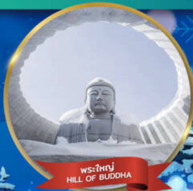
พระใหญ่ HILL OF BUDDHA

พักอาซาฮิคาว่า 1 คืน - โอตารุ 1 คืน - ซัปโปโร 2 คืน (ติดย่านช้อปปิ้ง)