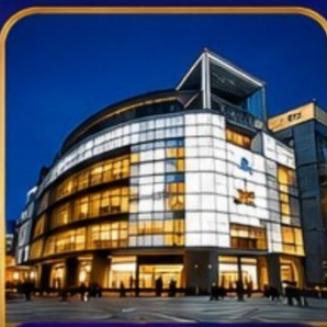
The Ring Mall