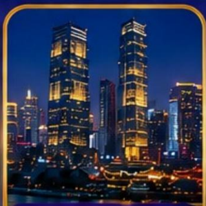
ตึกโค่วซิงไห่