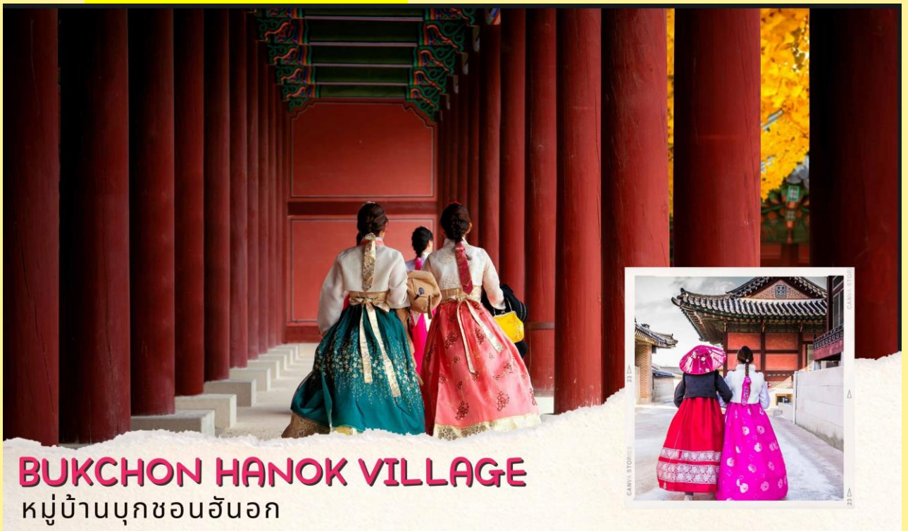
BUKCHON HANOK VILLAGE หมู่บ้านบุกซอนฮันอก

นำท่านชม ศูนย์โสมรัฐบาล (Ginseng) ซึ่งรัฐบาลรับรองคุณภาพว่าผลิตจากโสมที่มีอายุ 6 ปีซึ่งถือว่าเป็นโสมที่มีคุณภาพดีที่สุดในวงจรชีวิตของโสมพร้อมให้ท่านได้เลือกซื้อโสมที่มีคุณภาพดีที่ที่สุดและราคาถูกกว่าไทยถึง 2 เท่าเพื่อนำไปบำรุงร่างกายหรือฝากญาติผู้ใหญ่ที่ นำท่านชม ศูนย์น้ำมันสนเข็มแดง (Red Pine) เป็นผลิตภัณฑ์ที่สกัดจากน้ำมันสนมีสรรพคุณช่วยบำรุงร่างกายลดไขมันช่วยควบคุมอาหารและรักษาสมดุลในร่างกายได้เป็นอย่างดี จากนั้นชม พระราชวังเคียงบก ซึ่งเป็นพระราชวังไม้โบราณที่เก่าแก่ที่สุด กว่า 600 ปี ภายในพระราชวังแห่งนี้มีหมู่พระที่นั่งมากกว่า 200 หลัง แต่ได้ถูกทำลายไปมากในสมัยที่ญี่ปุ่นเข้ามาบุกยึด ทั้งยังเคยเป็นศูนย์บัญชาการทางการทหารและเป็นที่พักของกษัตริย์ ปัจจุบันได้มีการก่อสร้างหมู่พระที่นั่งที่เคยถูกทำลายขึ้นมาใหม่ในตำแหน่งเดิม ถ่ายภาพคู่กับพลับพลากลางน้ำเคียงเฮวรู ที่ซึ่งเคยเป็นท้องพระโรงออกงานโสมสรสันทิปาตต่าง ๆ (ให้เวลาท่านเข้าสู่ชุดฮันบกสวย ๆ หน้าพระราชวังและถ่ายรูปตามอัธยาศัย **ค่าเช่าชุดรวมไม่รวมในค่าทัวร์*** )