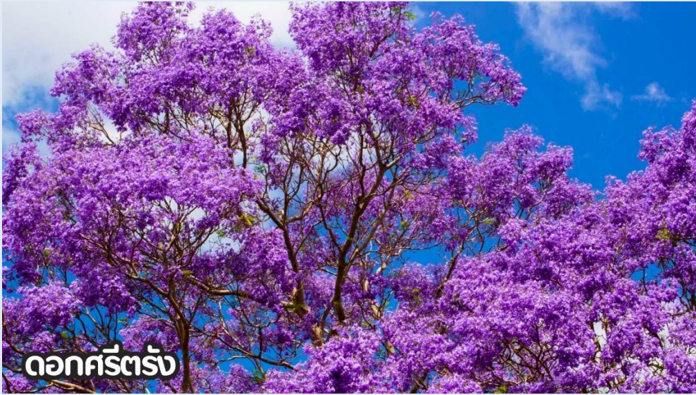
ดอกศรีตรัง

(ปลายเดือนพฤษภาคม-มิถุนายน): ชมดอกไม้ไฮเดรนเยีย ดอกไฮเดรนเยียที่คุนหมิง ประเทศจีน บานสะพรั่งสวยงามที่สุดในช่วงเดือนมิถุนายน โดยเฉพาะบริเวณทุ่งไฮเดรนเยีย (The Middle Sea Hydrangea Kunming) ซึ่งมีหลากสีทั้งฟ้า ชมพู และม่วง เป็นจุดถ่ายรูปยอดนิยมที่ห้ามพลาด เนื่องจากอากาศที่เย็นสบายและทิวทัศน์ที่งดงาม