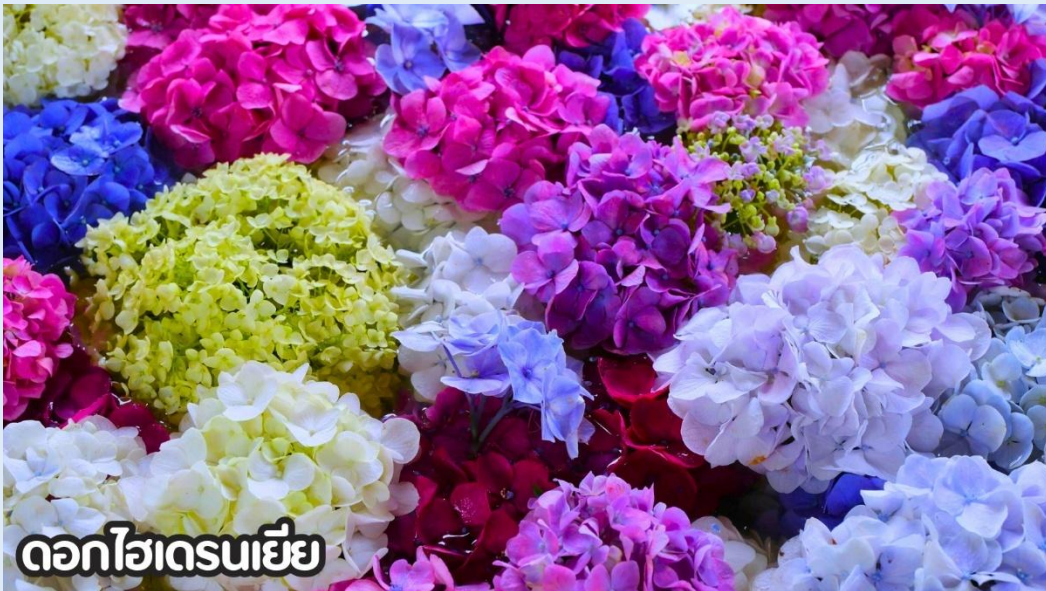
ดอกไฮเดรนเยีย

(ปลายเดือนพฤษภาคม-มิถุนายน): ชมดอกไม้ไฮเดรนเยีย ดอกไฮเดรนเยียที่คุนหมิง ประเทศจีน บานสะพรั่งสวยงามที่สุดในช่วงเดือนมิถุนายน โดยเฉพาะบริเวณทุ่งไฮเดรนเยีย (The Middle Sea Hydrangea Kunming) ซึ่งมีหลากสีทั้งฟ้า ชมพู และม่วง เป็นจุดถ่ายรูปยอดนิยมที่ห้ามพลาด เนื่องจากอากาศที่เย็นสบายและทิวทัศน์ที่งดงาม