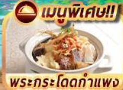
เมนูพิเศษ!! พระกระโดดกำแพง