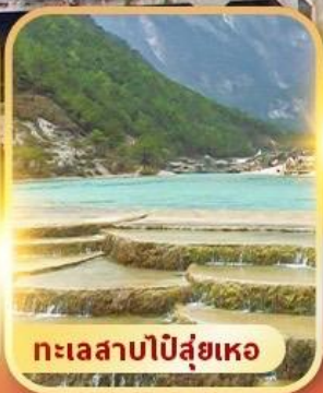
ทะเลสาบปิ๋สุ่ยเหอ