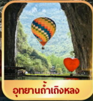
อุทยานถ้ำถึงหลง