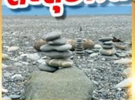
หาดซีซิง

เดินชมวิวเกาะเหอผิง ตะลุยกินตลาดมิชลินเคราเหอ