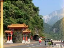
อุทยานทาโรโกะ