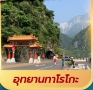
อุทยานทงไรโกะ