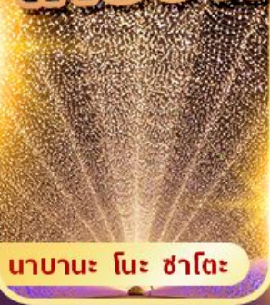
นาคานะ โนะ ซาโตะ