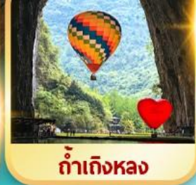
ท่าเกิงหลง