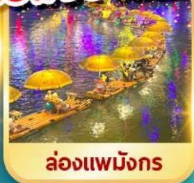
ล่องแพมังกร