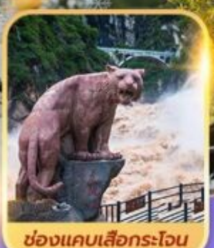
ช่องแคบเลื่อกระโจน