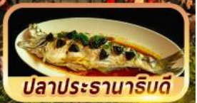
ปลาประรานาริมดี