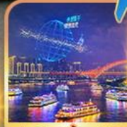
ล่องเรือแม่น้ำแยงซีเกียง