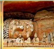
พาศินพระแกะสลักต้าจู๊