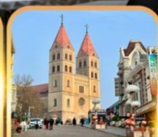
โบสถ์เซ็นต์ไมเคิล