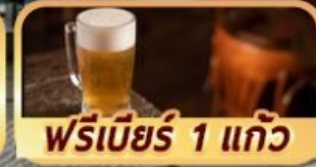
ฟรีเบียร์ 1 แก้ว