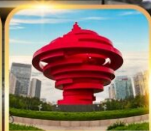
จตุรัสหาลี่