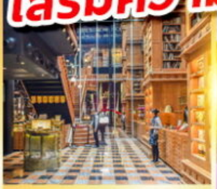
ร้านไอศกรีมมियाฮาระ