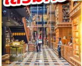
ร้านไอศกรีมมียาฮาร่า