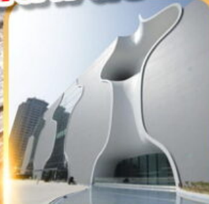
โรงละครไถจง