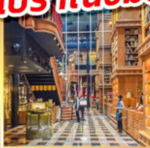
ร้านไอศกรีมมียาฮาร์