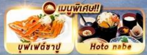
บุฟเฟ่ต์ซาปู